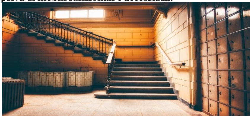
Esempio 8. Stanza scarsamente illuminata, con scale e priva di mobili funzionali e accessibili.