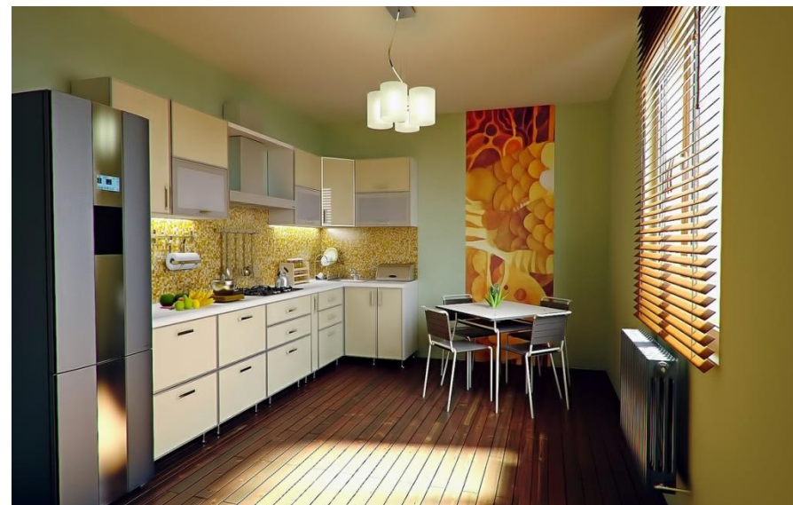
Voorbeeld 10. Niet-functionele keukens.