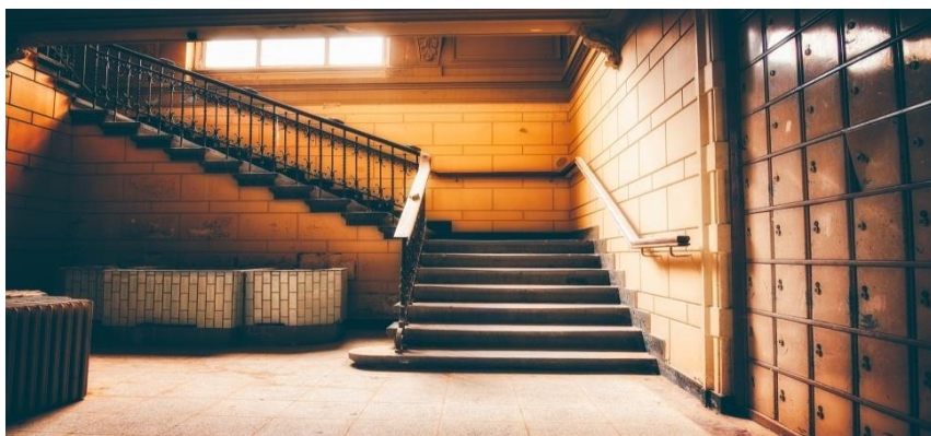
Voorbeeld 8. Kamer slecht verlicht, met trappen en gebrek aan functioneel en toegankelijk meubilair.