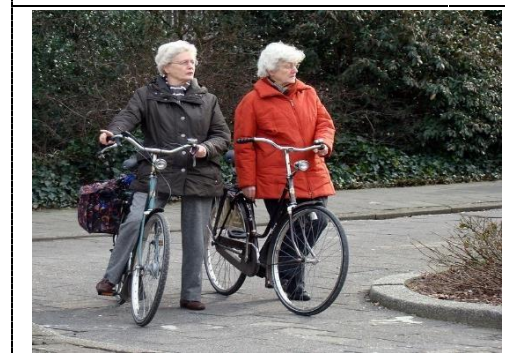
Muoversi da soli