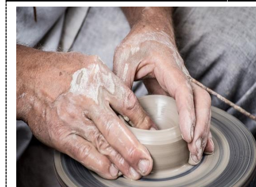
Lavoro e impiego