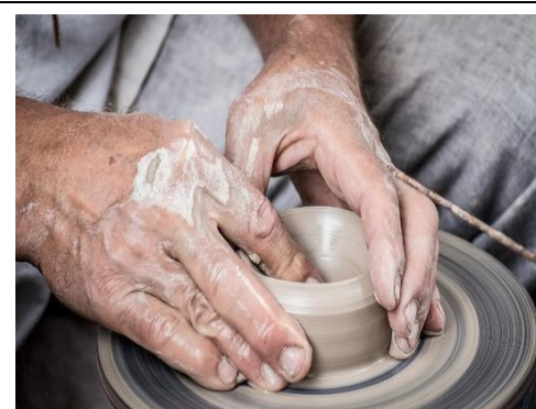
Delo in zaposlovanje