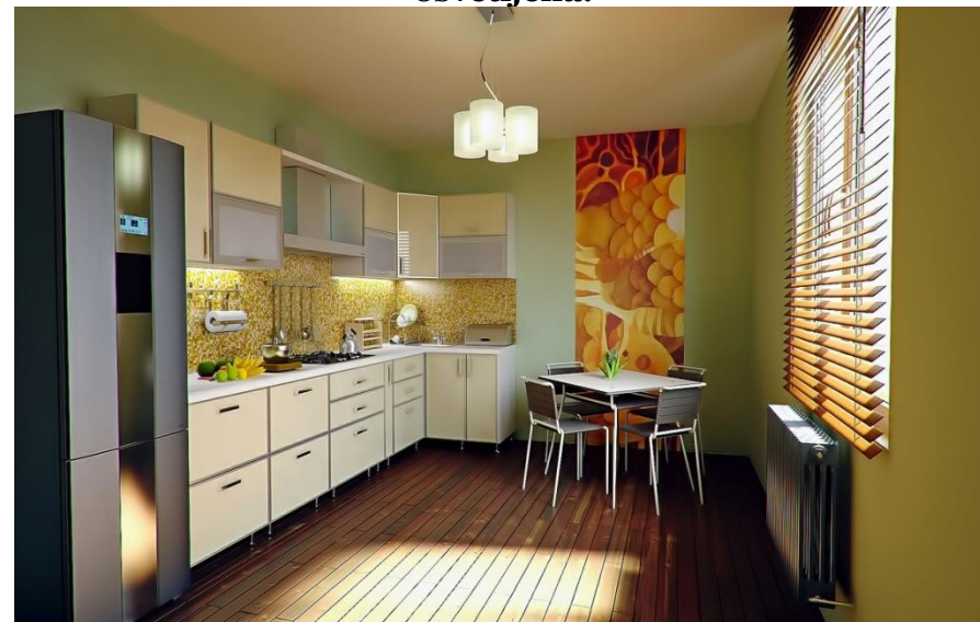
Primer št. 9 Prostorna kuhinja, zelo praktična in primerno osvetljena.