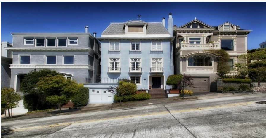
Primer št. 4 Stavbe z vhodnim stopniščem na zelo strmem hribu.