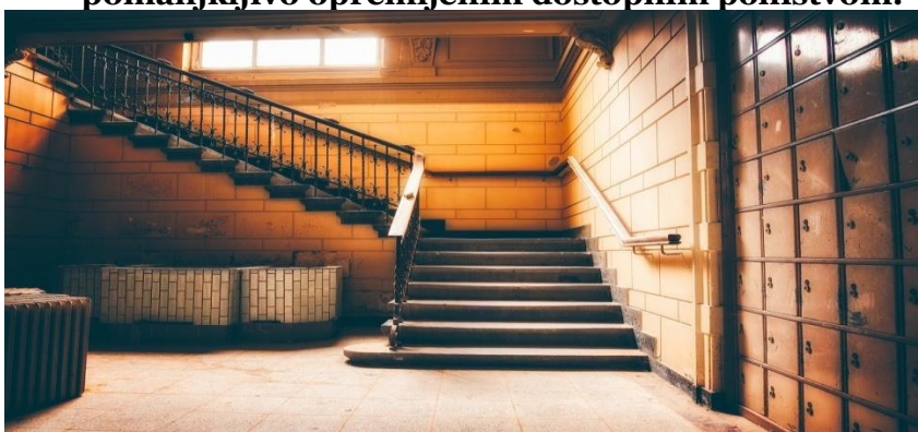
Primer št. 8 Slabo osvetljen prostor s stopniščem in pomanjkljivo opremljenim dostopnim pohištvom.